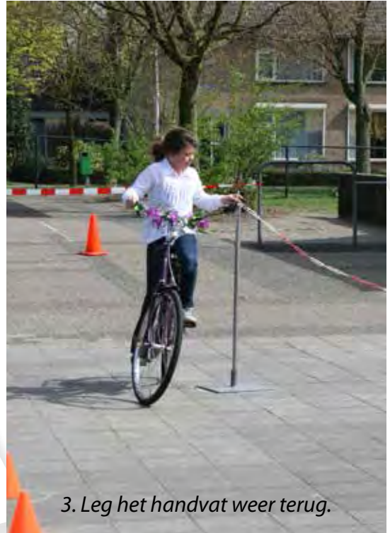
3. Leg het handvat weer terug.