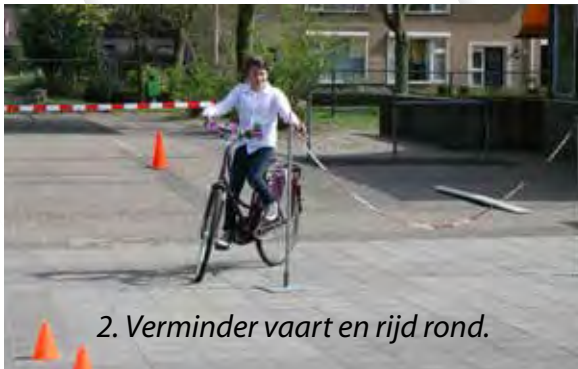
2. Verminder vaart en rijd rond.