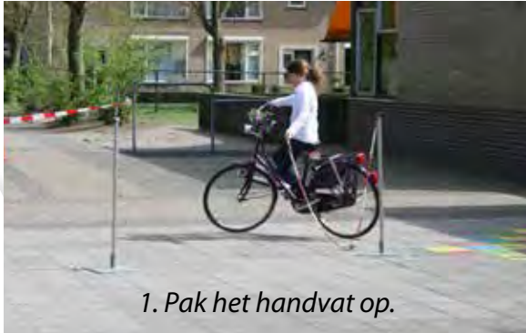
1. Pak het handvat op.